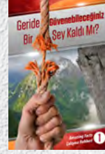
Çalışma Rehberi 1: Geride Güvenebileceğiniz Bir Şey Kaldı mı?