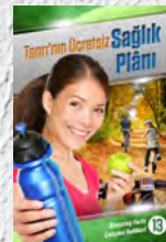
Çalışma Rehberi 13: Tanrı'nın Ücretsiz Sağlık Planı