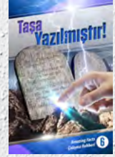
Çalışma Rehberi 6: Taşa Yazılmıştır!