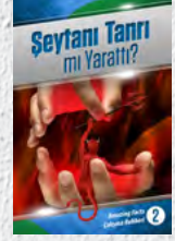
Çalışma Rehberi 2: Şeytani Tanrı mı Yarattı?