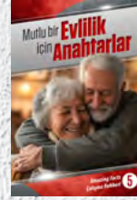
Çalışma Rehberi 5: Mutlu bir Evlilik için Anahtarlar