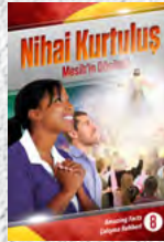
Çalışma Rehberi 8: Nihai Kurtuluş - Mesih'in Dönüşü