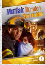
Çalışma Rehberi 3: Mutlak Ölümünden Kurtarıldık

Her ders sizi, alienizi dönüştürecek ve size sonsuz umut getirecek şaşırtıcı gerçeklerle doludur. Bir tanesini bile kaçırmayın!