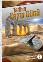
Çalışma Rehberi 7: Tarihin Kayıp Günü