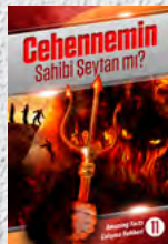
Çalışma Rehberi 11: Cehennemin Sahibi Şeytan mı?