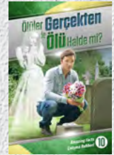
Çalışma Rehberi 10: Ölümler Gerçekten de Ölü Halde mi?