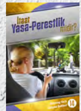
Çalışma Rehberi 14: İtaat Yasa-perestlik midir?

İlk 14 Çalışma Rehberimizi tamamladığımızda, daha ileri seviye olan setimizi isteyebilirsiniz.