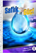
Çalışma Rehberi 9: Sağlık ve Güç!