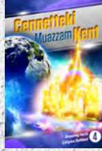
Çalışma Rehberi 4: Cennetteki Muazzam Kent