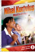
Çalışma Rehberi 8: Nihai Kurtuluş - Mesih'in Dönüşü