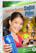
Çalışma Rehberi 13: Tanrı'nın Ücretsiz Sağlık Planı