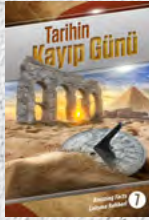
Çalışma Rehberi 7: Tarihin Kayıp Günü