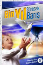
Çalışma Rehberi 12: Bin Yıl Sürecektir Barış