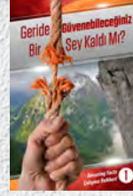
Çalışma Rehberi 1: Geride Güvenebileceğiniz Bir Şey Kaldı mı?