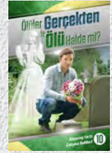
Çalışma Rehberi 10: Ölümler Gerçekten de Ölü Halde mi?