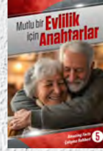
Çalışma Rehberi 5: Mutlu bir Evlilik için Anahtarlar