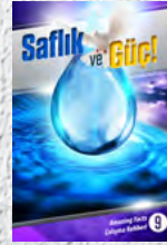
Çalışma Rehberi 9: Sağlık ve Güç!