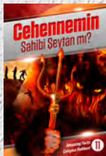
Çalışma Rehberi 11: Cehennemin Sahibi Şeytan mı?