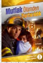
Çalışma Rehberi 3: Mutlak Ölümünden Kurtarıldık

Her ders sizi, alienizi dönüştürecek ve size sonsuz umut getirecek şaşırtıcı gerçeklerle doludur. Bir tanesini bile kaçırmayın!