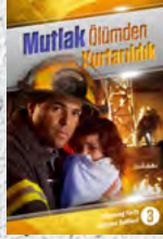
Çalışma Rehberi 3: Mutlak Ölümünden Kurtarıldık

Her ders sizi, alienizi dönüştürecek ve size sonsuz umut getirecek şaşırtıcı gerçeklerle doludur. Bir tanesini bile kaçırmayın!