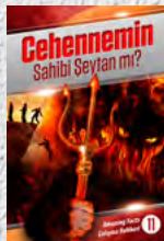
Çalışma Rehberi 11: Cehennemin Sahibi Şeytan mı?