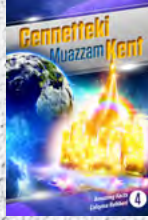
Çalışma Rehberi 4: Cenneteki Muazzam Kent