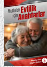
Çalışma Rehberi 5: Mutlu bir Evlilik için Anahtarlar