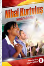
Çalışma Rehberi 8: Nihai Kurtuluş - Mesih'in Dönüşü