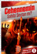
Çalışma Rehberi 11: Cehennemin Sahibi Şeytan mı?