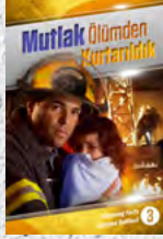
Çalışma Rehberi 3: Mutlak Ölümünden Kurtarıldık

Her ders sizi, alienizi dönüştürecek ve size sonsuz umut getirecek şaşırtıcı gerçeklerle doludur. Bir tanesini bile kaçırmayın!