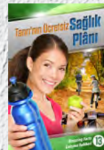
Çalışma Rehberi 13: Tanrı'nın Ücretsiz Sağlık Planı