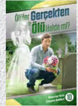
Çalışma Rehberi 10: Ölümler Gerçekten de Ölü Halde mi?