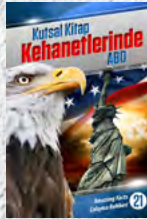
Çalışma Rehberi 21: Kutsal Kitap Kehanetlerinde ABD