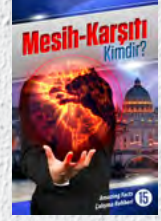
Çalışma Rehberi 15: Mesih-Karşıtı Kimdir?

Her ders sizi, ailenizi dönüştürecek ve size sonsuz umut getirecek şaşırtıcı gerçeklerle doludur. Bir tanesini bile kaçırmayın!