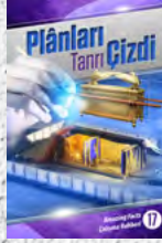
Çalışma Rehberi 17: Plânları Tanrı Çizdi