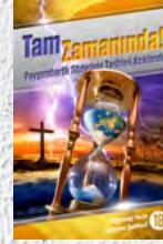
Çalışma Rehberi 18: Tam Zamanında!