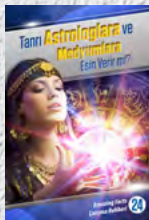
Çalışma Rehberi 24: Tanrı Astrologlara ve Medyumlara Esin Verir mi?