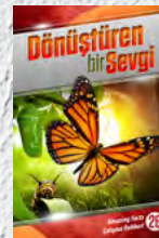
Çalışma Rehberi 26: Dönüştüren bir Sevgi