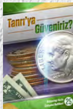
Çalışma Rehberi 25: Tanrı'ya Güveniriz?