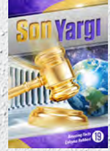
Çalışma Rehberi 19: Son Yargı