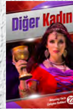
Çalışma Rehberi 22: Diğer Kadın