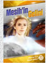
Çalışma Rehberi 23: Mesih'in Geline