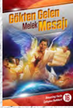
Çalışma Rehberi 16: Gökten Gelen Melek Mesajı