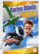
Çalışma Rehberi 27: Geriye Dönüş Yoktur

İlk 14 Çalışma Rehberimizi gördünüz mü? Cevabınız hayırsız, www.AmazingFactsPDF.org adresine baş vurunuz.