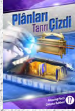
Çalışma Rehberi 17: Plânları Tanrı Çizdi