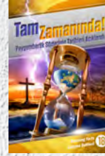
Çalışma Rehberi 18: Tam Zamanında!