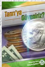
Çalışma Rehberi 25: Tanrı'ya Güveniriz?