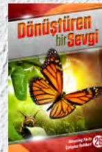
Çalışma Rehberi 26: Dönüştüren bir Sevgi