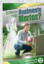
Manual de Estudos 10: Os Mortos estão Realmente Mortos?