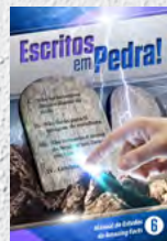
Manual de Estudos 6: Escritos em Pedra!