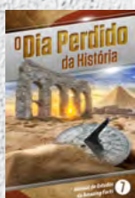
Manual de Estudos 7: O Dia Perdido da História