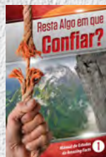
Manual de Estudos 1: Resta Algo em que Confiar?

Cada lição está repleta de fatos incríveis que transformarão você e sua família, trazendo esperança eterna. Estude cada um deles!