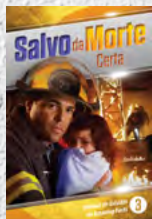
Manual de Estudos 3: Salvo da Morte Certa