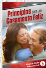
Manual de Estudos 5: Princípios Para um Casamento Feliz