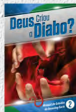
Manual de Estudos 2: Deus Criou o Diabo?