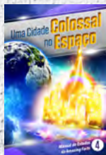
Manual de Estudos 4: Uma Cidade Colossal no Espaço