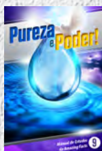
Manual de Estudos 9: Pureza e Poder!