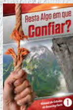
Manual de Estudos 1: Resta Algo em que Confiar?

Cada lição está repleta de fatos incríveis que transformarão você e sua família, trazendo esperança eterna. Estude cada um deles!