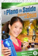
Manual de Estudos 13: O Plano de Saúde Gratuito de Deus