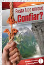
Manual de Estudos 1: Resta Algo em que Confiar?

Cada lição está repleta de fatos incríveis que transformarão você e sua família, trazendo esperança eterna. Estude cada um deles!