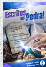
Manual de Estudos 6: Escritos em Pedra!