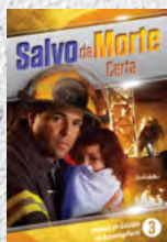
Manual de Estudos 3: Salvo da Morte Certa