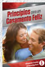
Manual de Estudos 5: Princípios Para um Casamento Feliz