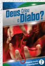
Manual de Estudos 2: Deus Criou o Diabo?