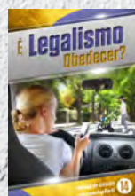
Manual de Estudos 14: É Legalismo Obedecer?

Ao concluir os 14 primeiros Manuais de Estudos, solicite nossa série avançada. Amazing Facts Brasil - Caixa Postal 18 - Bananeiras, PB 58220-000