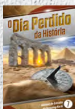
Manual de Estudos 7: O Dia Perdido da História