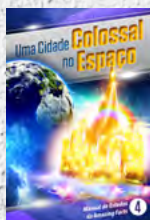
Manual de Estudos 4: Uma Cidade Colossal no Espaço