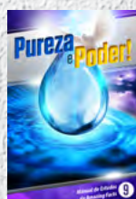
Manual de Estudos 9: Pureza e Poder!