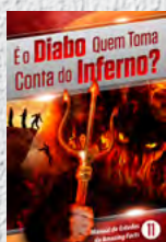
Manual de Estudos 11: É o Diabo Quem Toma Conta do Inferno?