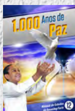
Manual de Estudos 12: 1.000 Anos de Paz