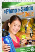
Manual de Estudos 13: O Plano de Saúde Gratuito de Deus