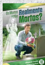
Manual de Estudos 10: Os Mortos estão Realmente Mortos?