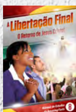
Manual de Estudos 8: A Libertação Final