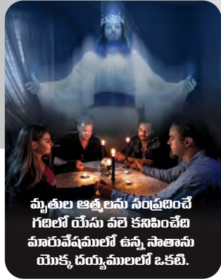
మృతుల ఆత్మలను సంగ్రహించే గణిలో యేసు వలె కనిపించేట వివేకవేషములలో ఉన్న సాతాను యొక్క దయ్యములలో ఒకటి.

“అవి సూచనలు చేయునట్టి దయ్యముల ఆత్మలే” (ప్రకటన 16:14). అబద్ధపు క్రీస్తులును అబద్ధపు ప్రవక్తలును వచ్చి, సాధ్యమైతే ఏర్పరచబడిన వారిని సహితము మోసపరచుటకై గొప్ప సూచక క్రియలను మహాత్కార్యములను కనబరచెదరు” (మత్తయి 24:24). “ధర్మశాస్త్రమును ప్రమాణ వాక్యమును విచారించుడి, ఈ వాక్యప్రకారము వారు బోధించని యెడల వారికి అరుణోదయము కలుగదు” (యెషయా 8:20).