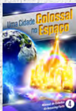
Manual de Estudos 4: Uma Cidade Colossal no Espaço