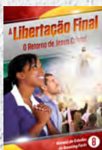
Manual de Estudos 8: A Libertação Final