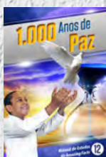
Manual de Estudos 12: 1.000 Anos de Paz