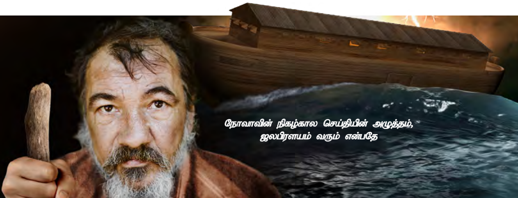
நோவாவின் நிகழ்கால செய்தியின் அமுத்தம், ஜலபிரளயம் வரும் என்பதே

ஈ. முத்தாது (வெளி. 14:6–14). இன்றைக்கான தேவனுடைய “நிகழ்கால சத்தியம்” முத்தாத்தில் இருக்கிறது. ஆம், இயேசு கிறிஸ்துவினால் மாத்திரமே இரட்சிப்பு என்பது இந்த செய்திகளின் மையம். எனினும், இயேசுவின் இரண்டாம் வருகைக்கு மக்களை ஆயத்தப்படுத்தவும், சாத்தானின் மயக்கும் வஞ்சனைகளுக்கு கண்களைத் திறக்கவும் இந்த முத்தாது கொடுக்கப்பட்டிருக்கிறது. மக்கள் இந்த செய்திகளை புரிந்துகொள்ளாவதில் சாத்தான் அவர்களை அழித்துவிடுவான். இந்த விசேஷ செய்திகள் நமக்கு அவசியம் என்று இயேசு அறிவார். எனவே அன்பினால் கொடுத்திருக்கிறார். இவைகள் நெகிழ்படக்கூடாது. அடுத்த எட்டு வேதபாடங்களில் ஒவ்வொரு குறிப்பாக அவைகளை ஆராய்வேம். நீங்கள் கண்டுபிடிக்கிறவைகளில் சில அதிர்ச்சியூட்டுவதாயிருக்கலாம். எனினும் அனைத்தும் முழுமையானதாக இருக்கும். உங்கள் இருதயம் தூண்டப்படும். இயேசு உங்களிடம் பேசுவதை நீங்கள் உணர்வீர்கள். இவைகள் அவரின் செய்திகளே.