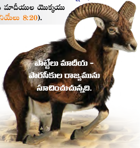
పాట్టెలు మాదీయ - పారసీకుల రాజ్యమును సూచించుచున్నవి.

జవాబు : పాట్టెలు, దానియేలు 7:5 లో ఎలుగుబంటిగా సూచింపబడిన ప్రపంచ రాజ్యమైన మాదీయ-పారసీకుల రాజ్యమును సూచించుచున్నది (స్టడీ గైడ్ 15వ పత్రికను కూడ చూడండి). బైబిలులోని దానియేలు మరియు ప్రకటన గ్రంథములలోని ప్రవచనములు “పునరావృతము మరియు విస్తరణ” అనే సూత్రమును పాటిస్తాయి, దీనివల్ల మనగా ఈ గ్రంథములు వాటి మునుపటి అధ్యాయాలలో ఉన్న ప్రవచనాలను పునరావృతము చేసి ఆ ప్రవచనాలను మరింత విస్తరించి వివరముగా వర్ణిస్తాయి. ఈ విధానం బైబిల్ ప్రవచనాలకు స్పష్టత మరియు నిశ్చయతను తెస్తుంది.