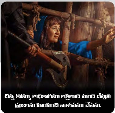
చిన్న కొమ్ము అధికారము లక్షలాది మంది దేవుని ప్రజలను హింసింది నాశనము చేసెను.

ఈ చిన్న కొమ్ము అధికారము అనేక మంది దేవుని ప్రజలను నాశనము చేసి (10, 24, 25 వ పదనములు) సత్యమును నేలపాలు కూడ చేయునని (12వ పదనము) దానియేలు 8వ అధ్యాయము మనకు తెలియ జేయుచున్నది. దేవుని ప్రజలు మరియు పరలోక ఆలయము ఎంత