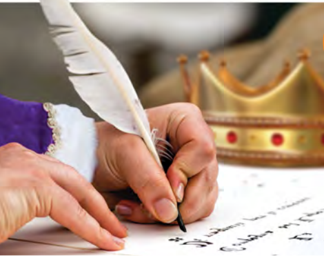
క్రీ.పూ. 457 సంవత్సరములో యెరూషలేమును మరల కట్టుటకు రాజైన అర్తహాషప్ప ఆదేశముల నిచ్చెను.