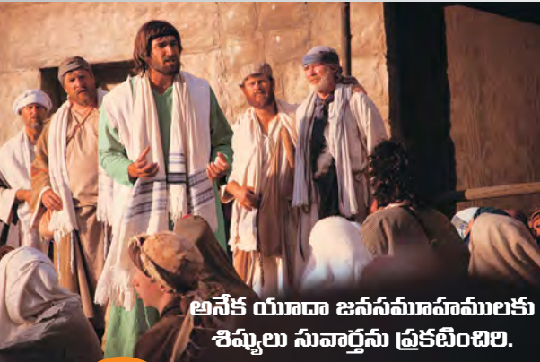
అనేక యూదా జననీమూహములకు శిష్యులు సువార్తను ప్రకటించిరి.

యేసు మూడున్నర సంవత్సరముల తరువాత మరణించెను గనుక, దానియేలు 9:27 లోని ప్రవచనము ప్రకారము, ఆయన చివరి ఏడు సంపూర్ణ సంవత్సరముల వరకు “అనేక కులకు నిబంధనను” ఎట్లు స్థిరపరచును?