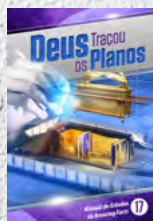
Manual de Estudos 17: Deus Traçou os Planos