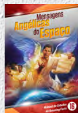
Manual de Estudos 16: Mensagens Angélicas do Espaço