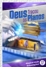
Manual de Estudos 17: Deus Traçou os Planos