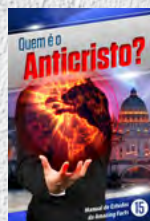
Manual de Estudos 15: Quem é o Anticristo?

Cada lição está repleta de fatos incríveis que transformarão você e sua família, trazendo esperança eterna. Estude cada um deles!