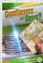
Manual de Estudos 25: Confiamos em Deus?