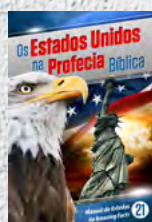
Manual de Estudos 21: Os Estados Unidos na Profecia Bíblica