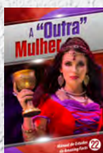
Manual de Estudos 22: A "Outra" Mulher