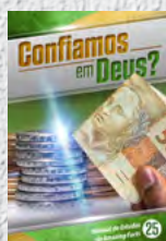
Manual de Estudos 25: Confiamos em Deus?