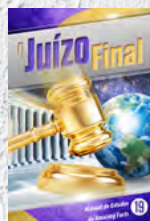
Manual de Estudos 19: O Juízo Final