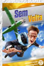
Manual de Estudos 27: Sem Volta

Você já viu nossos 14 primeiros Manuais de Estudos? Ainda não? Então, escreva para: