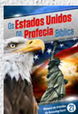
Manual de Estudos 21: Os Estados Unidos na Profecia Bíblica