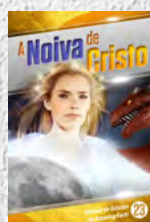
Manual de Estudos 23: A Noiva de Cristo