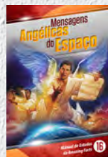
Manual de Estudos 16: Mensagens Angélicas do Espaço