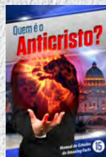
Manual de Estudos 15: Quem é o Anticristo?

Cada lição está repleta de fatos incríveis que transformarão você e sua família, trazendo esperança eterna. Estude cada um deles!