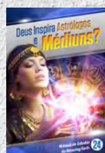
Manual de Estudos 24: Deus Inspira Astrólogos e Médiums?