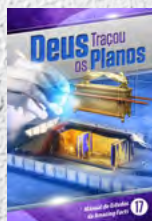
Manual de Estudos 17: Deus Traçou os Planos