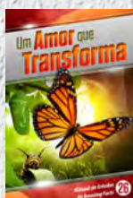
Manual de Estudos 26: Um Amor que Transforma