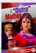
Manual de Estudos 22: A "Outra" Mulher