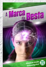
Manual de Estudos 20: A Marca da Besta